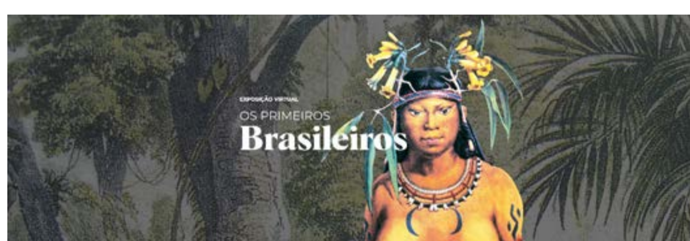
Contribuiu com a Programa-se: Equipe de Eventos/NUCE.