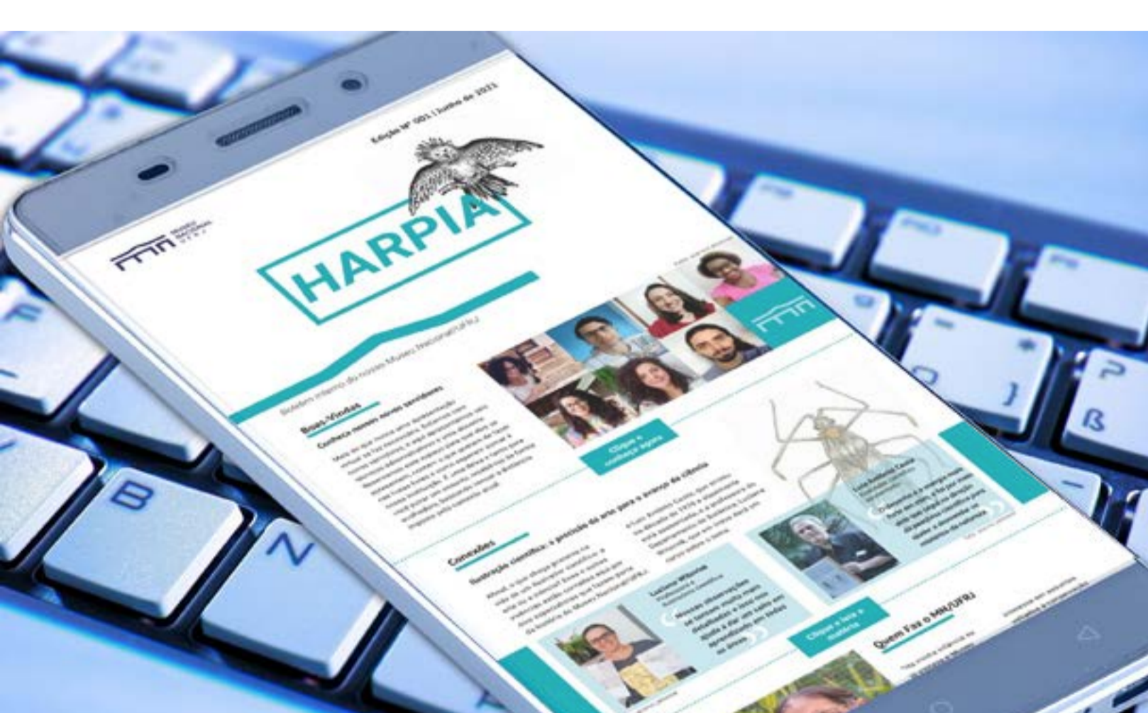
fotomontagem: Anna Bayer