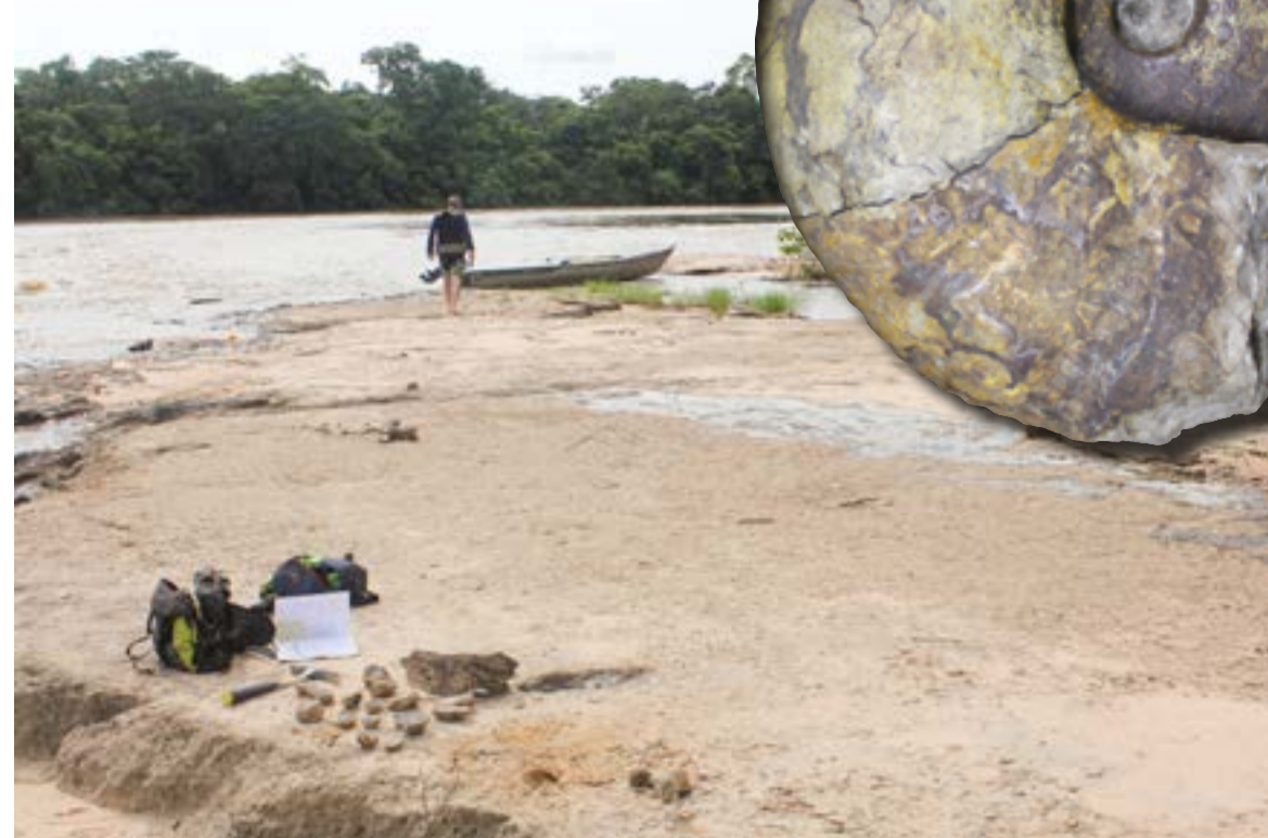
Sítio arqueológico