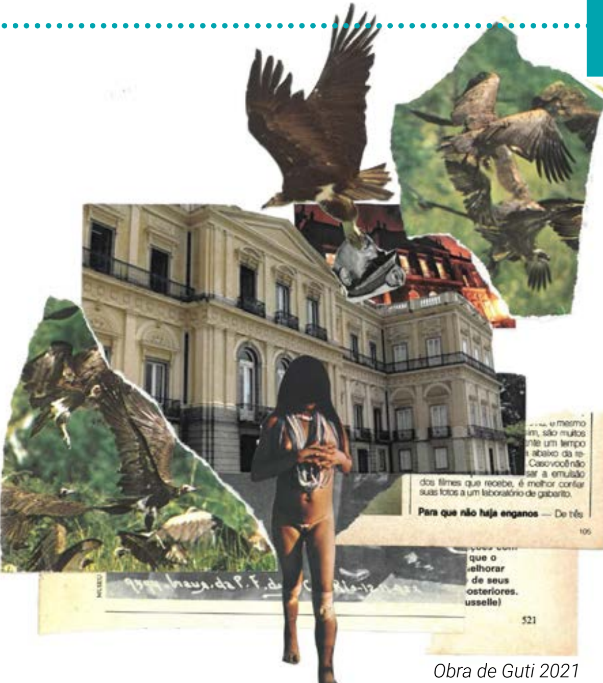
Obra de Gutti 2021

Fotografias documental e artística, gravuras, pinturas, ilustrações, poesias, crônicas e relatos buscaram situar o Museu Nacional/UFRJ como espaço de pesquisa e de memória no concurso artístico-cultural "Museu em Nós: Pontes e (des)OBRAmentos". O resultado foi apresentado na manhã de 16 de julho, durante o Festival do Conhecimento.